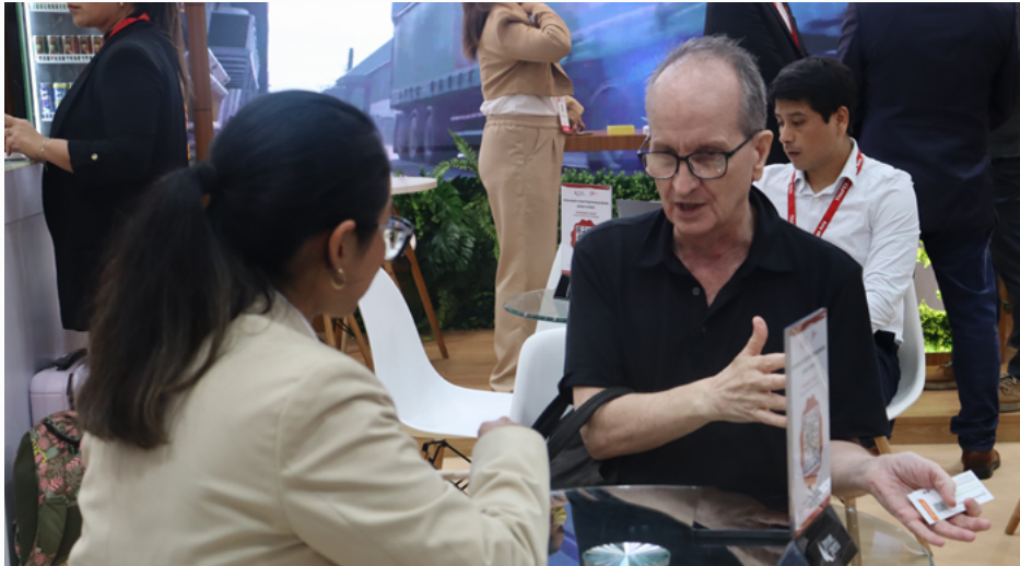
Compradores internacionales negocian con expositores peruanos durante los días de feria.