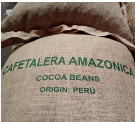
El cacao en grano es uno de sus productos más demandados.

Actualmente, el cacao que produce la firma llega a Malasia,