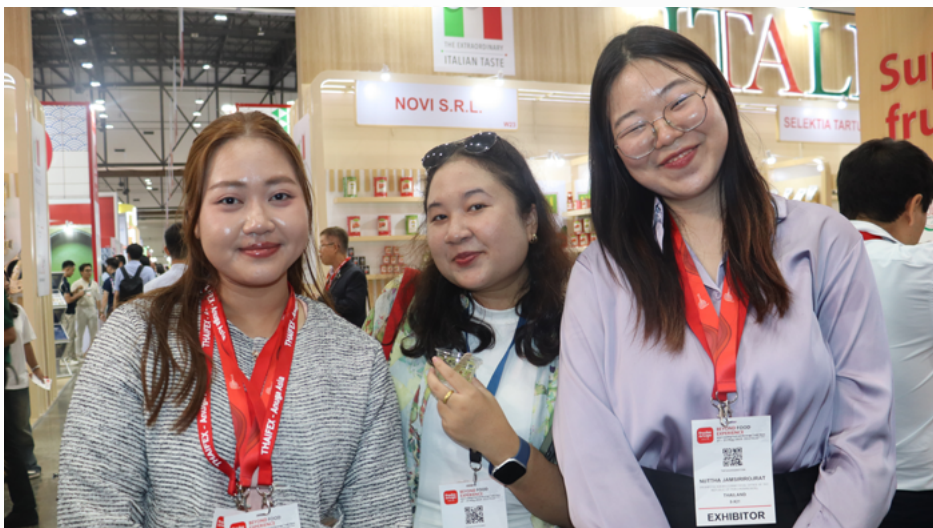
Visitantes asiáticos también degustan parte de la oferta peruana.