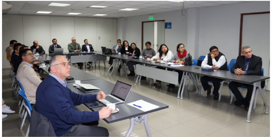
El Comité de Comercio e Importaciones en una de sus últimas reuniones presenciales en ADEX.

Los próximos eventos de la gerencia de Servicios e Industrias Extractivas, el IX Foro Logístico y el X Foro de Herramientas Financieras, serán espacios clave de networking y actualización que beneficiarán significativamente a los miembros del comité.