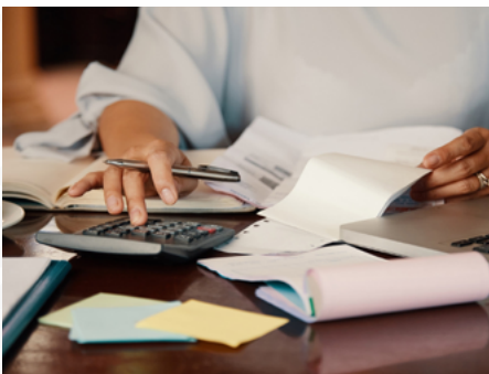
E&M Asesoría y Consultoría Empresarial busca impulsar la cultura tributaria.

Aunque su especialización está en el comercio exterior, la consultora también atiende otros rubros como