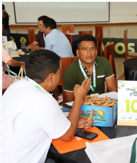
El jengibre y la cúrcuma fueron los productos más ofertados.

También USDA, Asociación Sumaq Kipatsi, Apescen, Cooperativa Central Alta Montaña, Cooperativa Agraria Industrial HVSU, Cooperativa Agraria Selva Sostenible, Cainprocc,