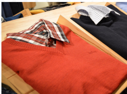
Los suéteres de punto de algodón fueron los más exportados.

El evento, a realizarse el próximo 25 de junio en el Hotel Los Delfines, tiene como auspiciadores a Industrias Nettalco, Textil del Valle, Financiera Qapaq, Billex, Topy Top, Textile Sourcing Company, PreveX y Textiles Camones. Asimismo, los aliados estratégicos Incalpaca,