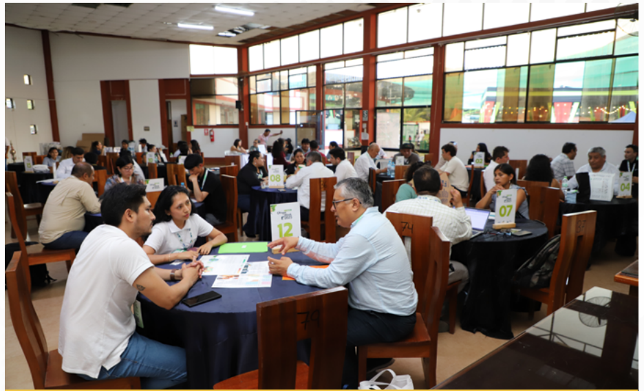
La rueda de negocios concretó 303 citas de negocio.