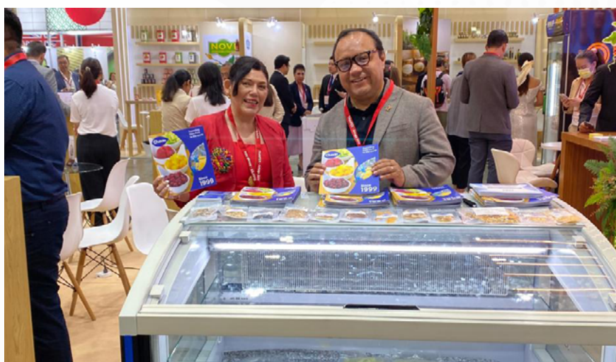
La empresa Chavín, una de las expositoras en el Pabellón Perú, exhibe su oferta de congelados.