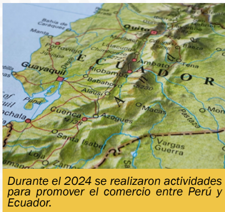
Durante el 2024 se realizaron actividades para promover el comercio entre Perú y Ecuador.

Estas gestiones se realizaron en coordinación con el Ministerio de Desarrollo Agrario y Riego